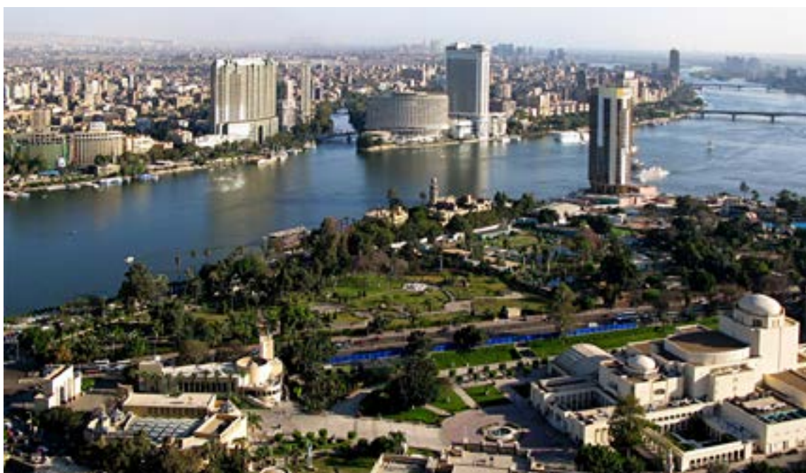
El río Nilo a su paso por El Cairo.

Pero existen muchos más conjuntos arqueológicos de igual interés y menor popularidad que permiten disfrutar de ellos en relativa intimidad, como por ejemplo, los complejos de pirámides de Abusir y Dashur,