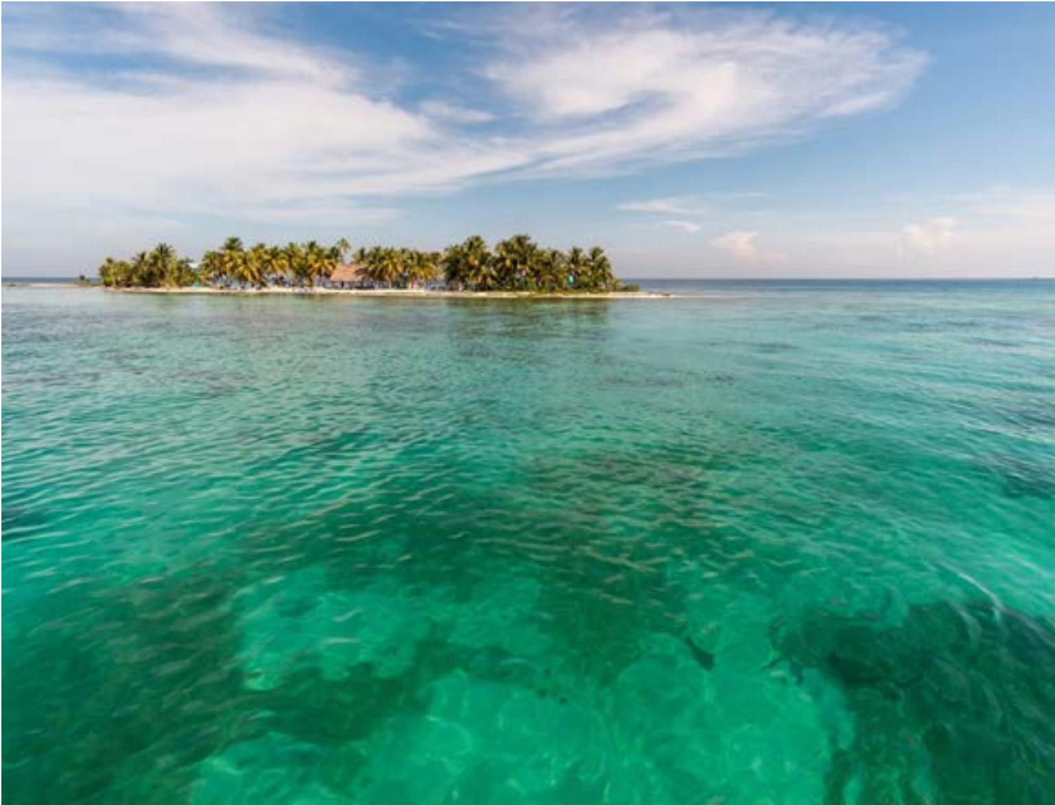
En Cayo Ambergris se halla la isla de San Pedro, es una región protegida por la Barrera de Arrecife del Caribe, conocida por ser la segunda en su tipo más grande del planeta.

Belice. Se localiza en la región central del país en el distrito de Cayo. Con una población estimada de 30.000 habitantes. Belmopán es una de las capitales más pequeñas del mundo. Belmopán se fundó y se convirtió en la capital beliceña en 1970 después de la gran destrucción que causó un huracán a la Ciudad de Belice (la antigua capital) en 1961. En Cayo Ambergris se halla la isla de San Pedro, es una re-