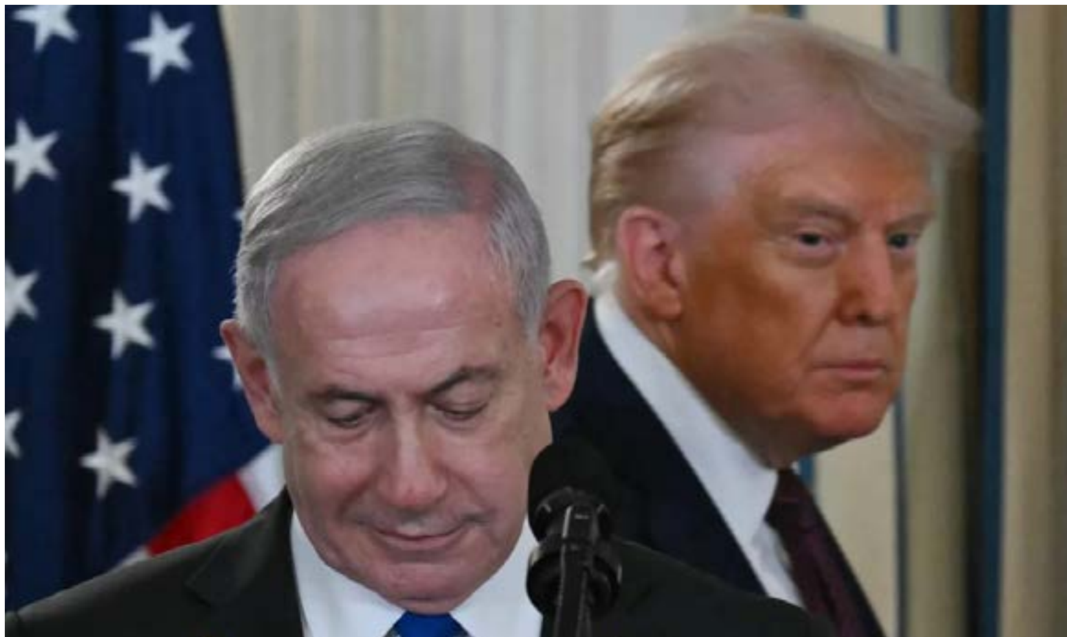
Estados Unidos e Israel acuerdan plan para Gaza mientras Hamás promete revisarlo

E l tablero del conflicto en Oriente Próximo experimenta un giro dramático. Tras la reunión en la Casa Blanca, el presidente Donald Trump ha proclamado que es «un día histórico para la paz», después de que el primer ministro israelí, Benjamin Netanyahu, diera su visto bueno al plan estadounidense de 20 puntos para poner fin a la guerra en la Franja de Gaza. Sin embargo, la materialización de este acuerdo pende de la decisión de Hamás, al que Israel ha lanzado un ultimátum.