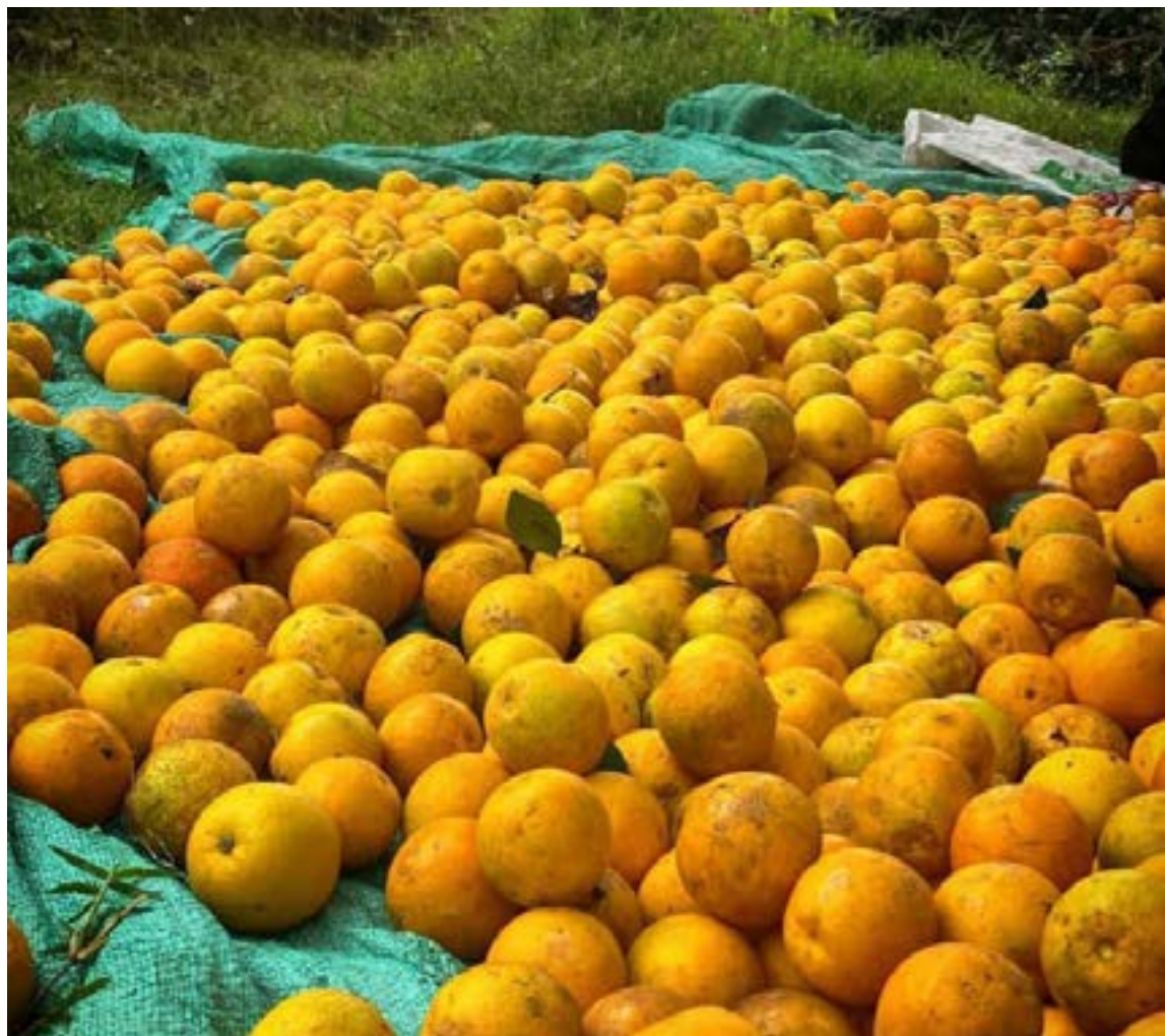
En la Plaza Manuel Murillo Toro se transformó en un centro de acopio y venta directa. Allí se comercializaron más de dos toneladas de naranja provenientes de la vereda San José de Tetuán, en el municipio de San Antonio.

El éxito de la jornada se cimentó en la articulación de varias entidades: La Sexta Brigada, el Batallón de Infantería N.º 17 y el Batallón de Apoyo de Acción Integral y Desarrollo N.º 5, bajo el programa Fe en Colombia, activaron sus capacidades logísticas. Facilitaron el traslado de la cosecha desde la zona rural hasta la capital, incluyendo vehículos,