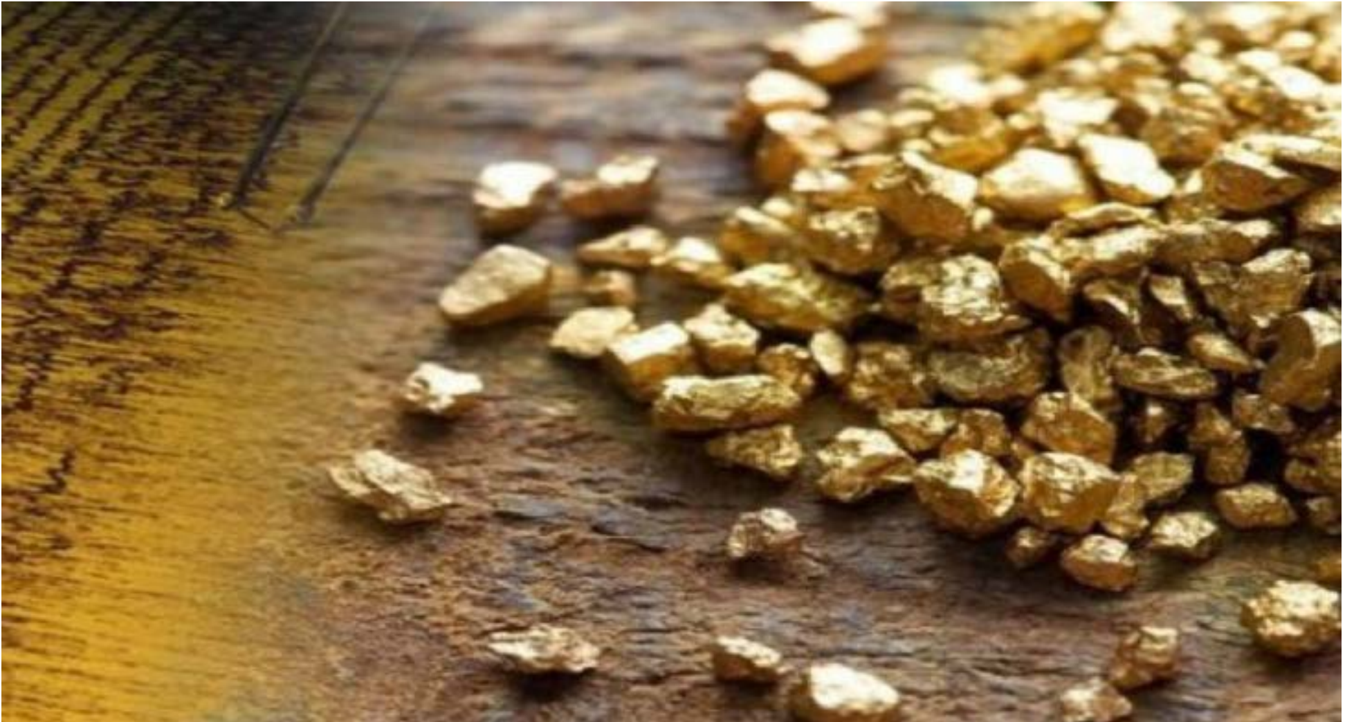
Los actuales precios del oro, sin duda, van a provocar que más gente se pase de la coca a la minería ilegal.

complejos mecanismos para dar una apariencia de legalidad a su producción, burlando los controles estatales: