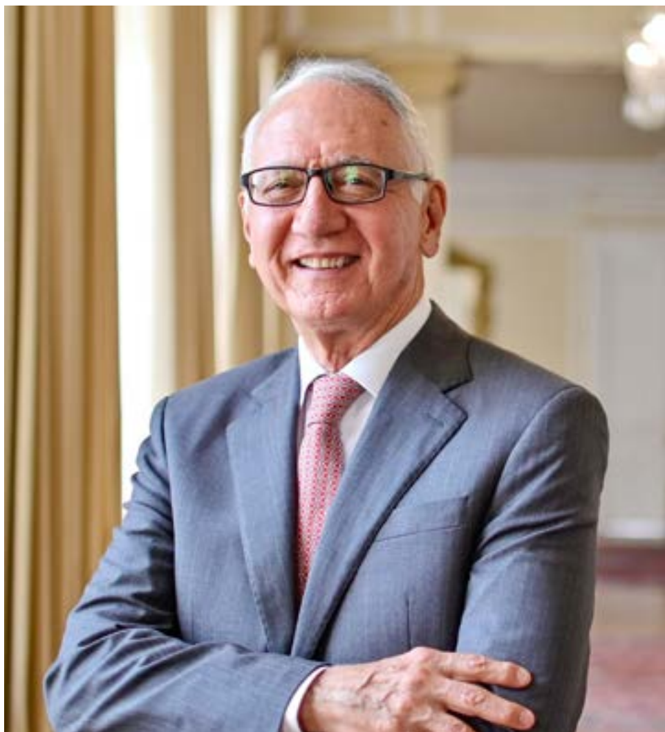
Guillermo Alfonso Jaramillo, ministro de Salud