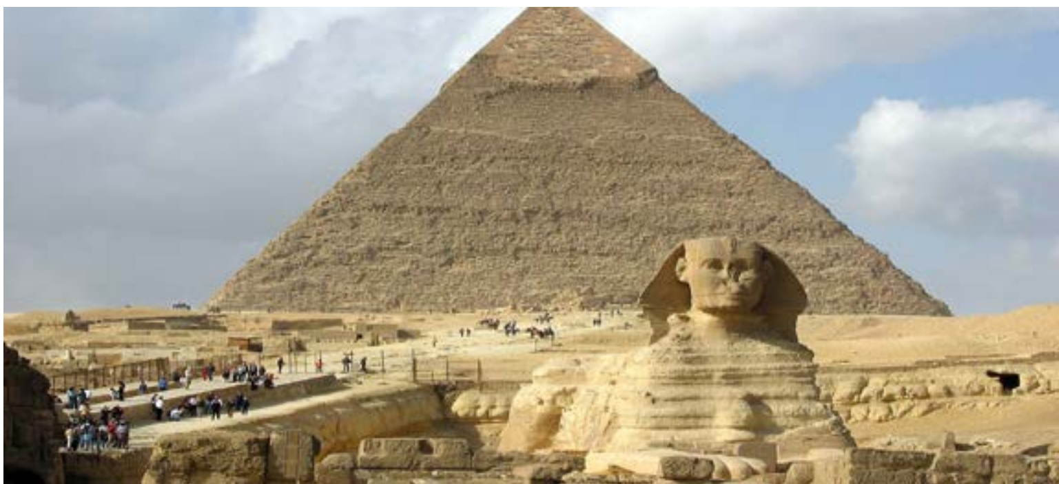
La esfinge y las pirámides de Guizga construidas durante el imperio antiguo de Egipto.

El Cairo es la capital de Egipto y la mayor ciudad de África y Oriente Medio. Es un hormiguero diario que abarrota sus calles. Es una ciudad misteriosa, con un encanto especial. Desde el amanecer hasta la puesta de sol, el murmullo de la ciudad se entremezcla con el canto de los almuédanos que llaman a la oración desde sus miles de alminares; de ahí que también se le conozca como la «Ciudad de los Mil Alminares». Su origen se remonta a la época faraónica, pero no fue hasta la invasión persa del año 525 a. de