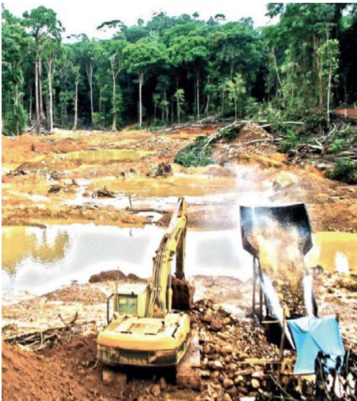
La minería ilegal de aluvión, que se concentra en los ríos Cauca y Nechí, es la principal fuente de destrucción ambiental, causando una grave contaminación por mercurio y cianuro.

tiene efectos devastadores sobre las comunidades y el territorio: